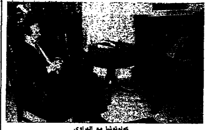
كولوتوشا مع الهراوي

زار سفير الاتحاد السوفياتي في لبنان فاسيل كولوتوشا ظهر امس الرئيس الهراوي في المقر الرئاسي المؤقت في الرملة البيضاء وجرى عرض للتطورات. وكان السفير كولوتوشا زار عد الحفوة بعشرة من قبل القاهر الرئيس السيد حسين الحسيني اكنفي بعد اللقاء بالقول: بعد القمة السوفياتية - الاميركية نتحدث.